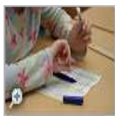
Geschichte der Aktion von „wir helfen“