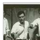
„Knacki“ Deuser - ein Comedian-Leben