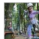
Kletterpartie im Hochseilgarten