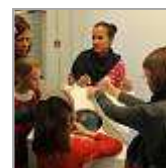
UPDATE: Die Messe „Art Fair“ und „Bloor