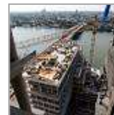
Das Köln-Barometer - steht es um Köln